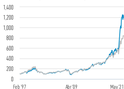
Rentabilidad de 100 USD invertidos desde el lanzamiento (valor en efectivo)

— Clase A Acciones — Russell 1000 Growth Net 30% Withholding Tax TR Index